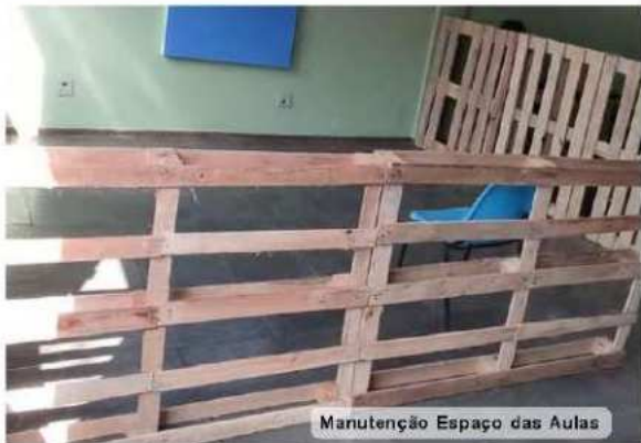
Manutenção Espaço das Aulas