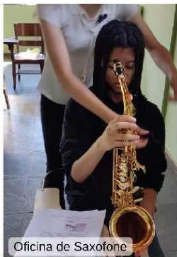
Oficina de Saxofone