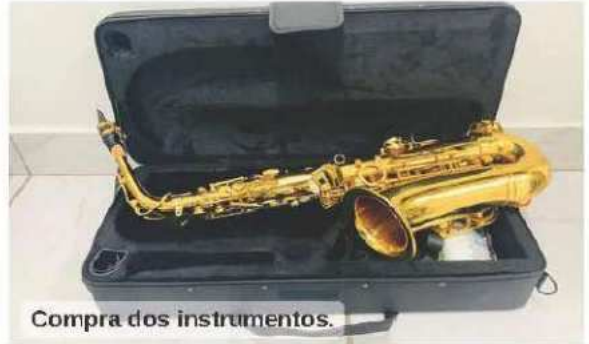
Compra dos instrumentos.