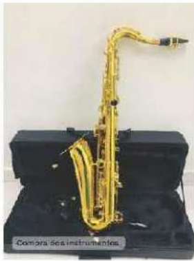
Compra dos instrumentos.