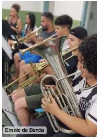
Ensaio da Banda