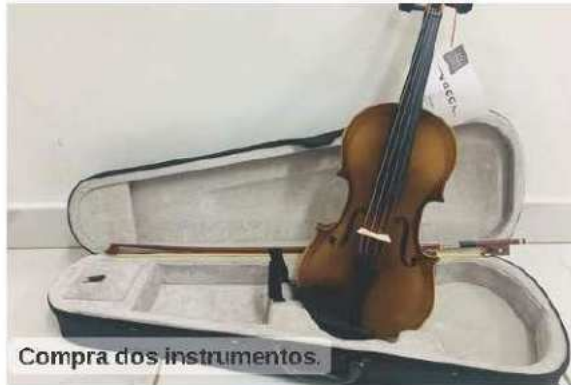
Compra dos instrumentos.