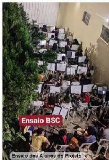
Ensaio dos Alunos do Projeto