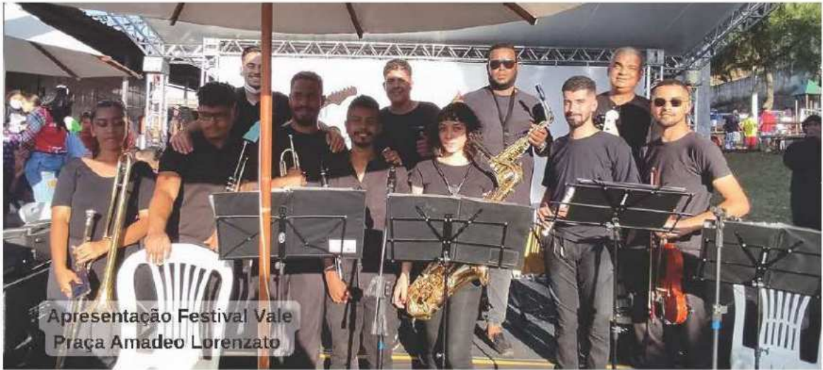
Apresentação Festival Vale Praça Amadeo Lorenzato