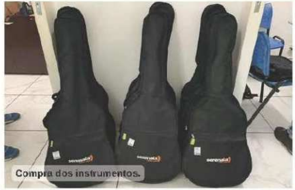
Compra dos instrumentos.