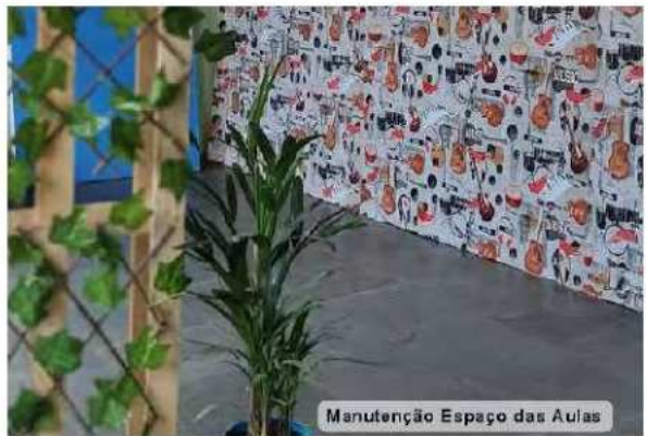
Manutenção Espaço das Aulas