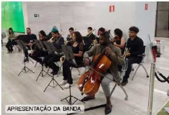
APRESENTAÇÃO DA BANDA