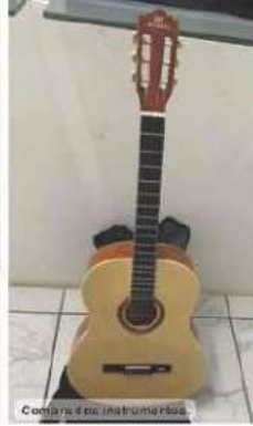
Compra dos instrumentos.