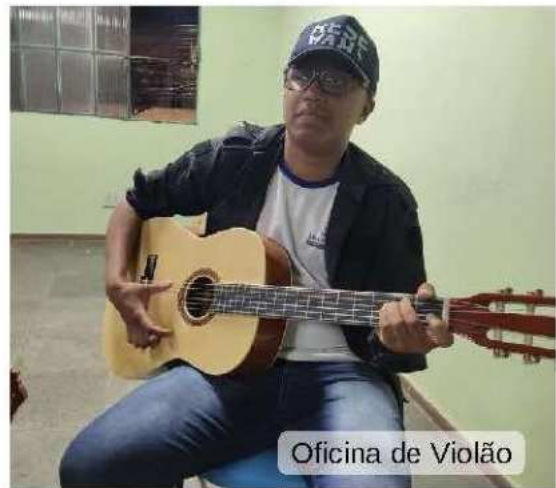
Oficina de Violão