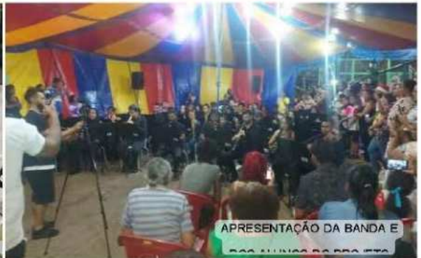
APRESENTAÇÃO DA BANDA E