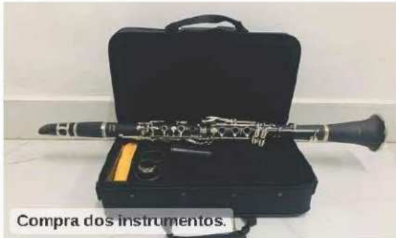
Compra dos instrumentos.