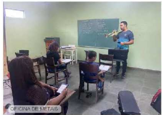
OFICINA DE METAIS