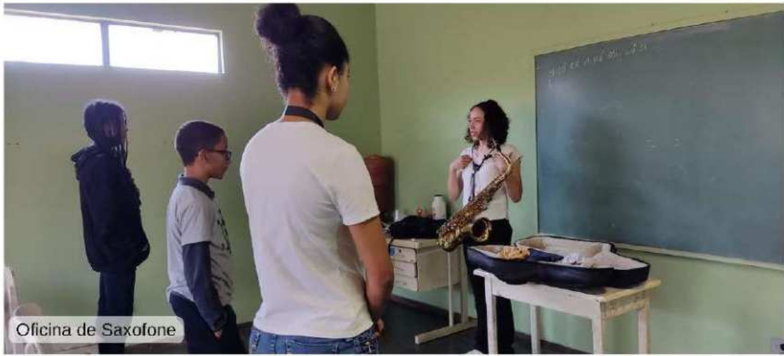
Oficina de Saxofone