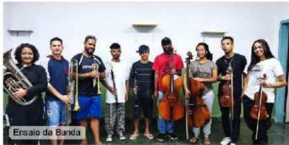
Ensaio da Banda