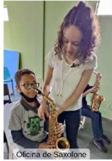
Oficina de Saxofone