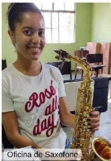
Oficina de Saxofone