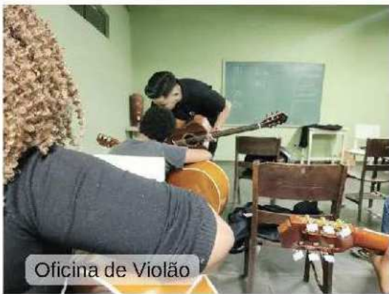
Oficina de Violão