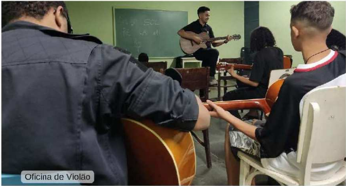
Oficina de Violão