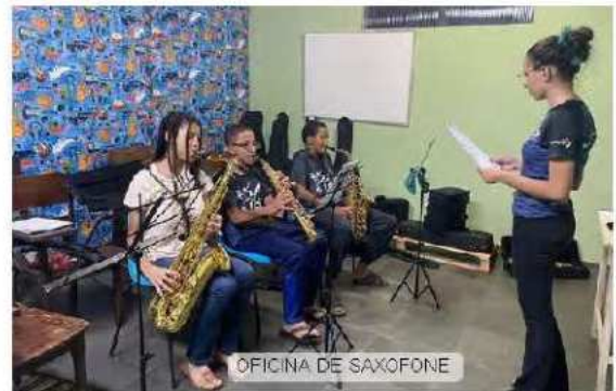
OFICINA DE SAXOFONE