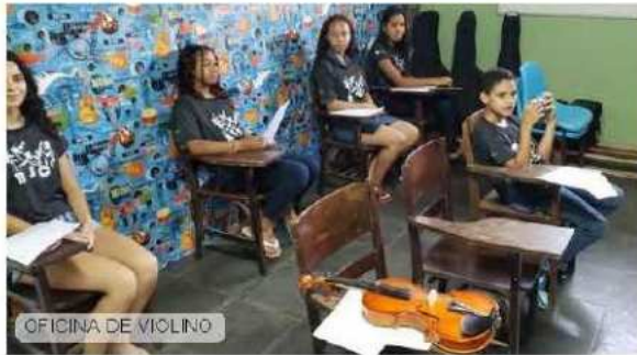
OFICINA DE VIOLINO