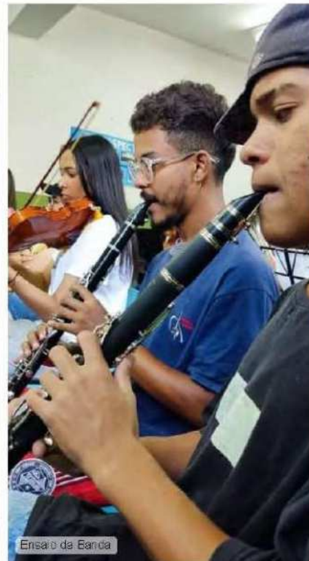
Ensaio da Banda