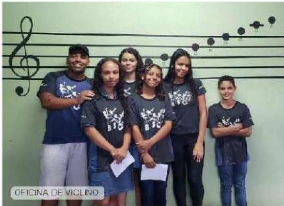
OFICINA DE VIOLINO