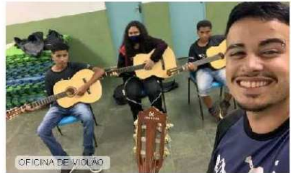
OFICINA DE VIOLÃO