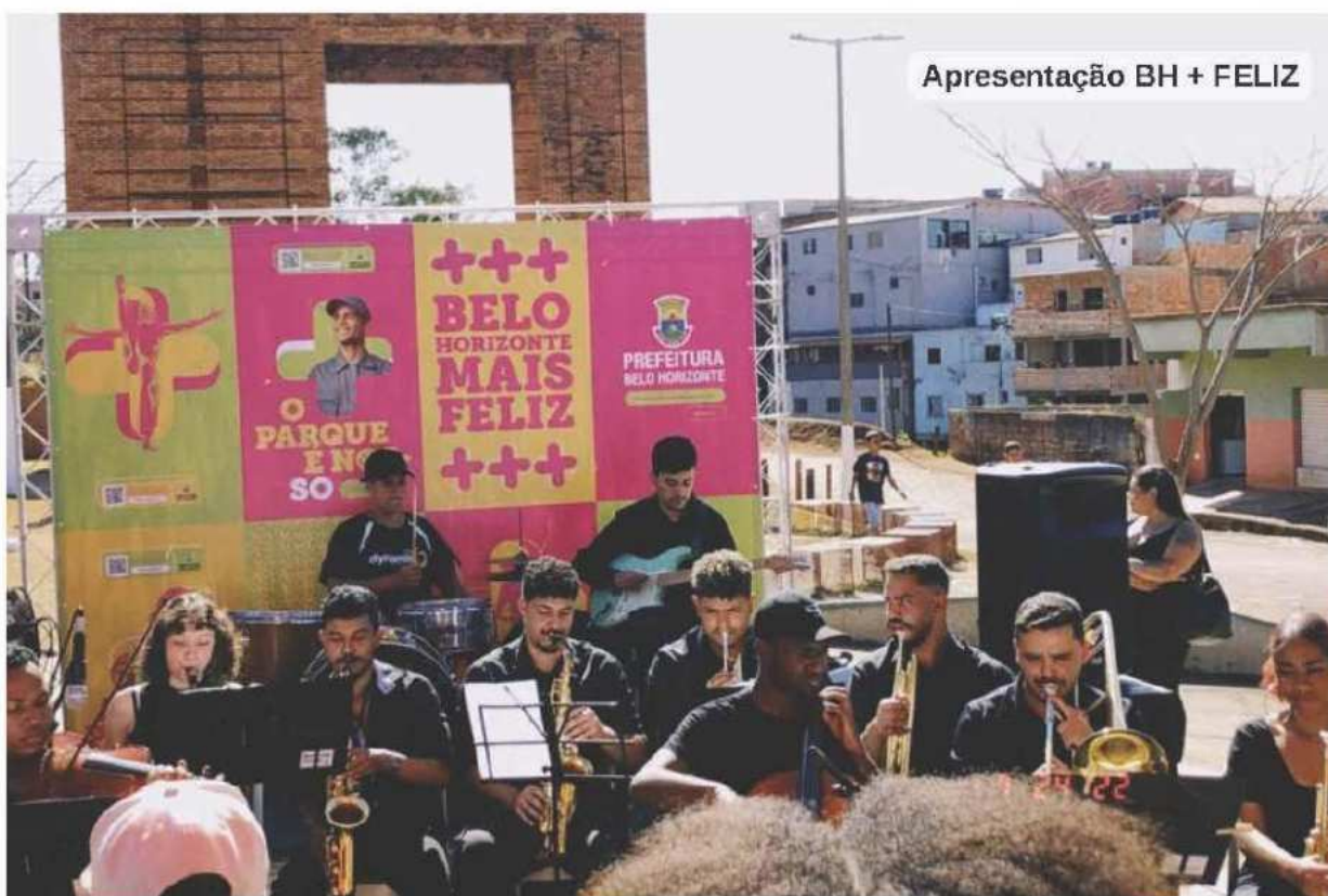
Apresentação BH + FELIZ