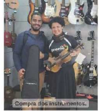
Compra dos instrumentos.