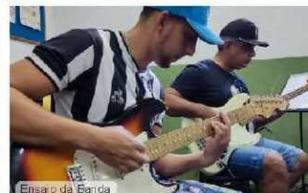
Ensaio da Banda