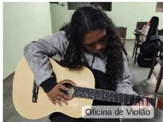
Oficina de Violão