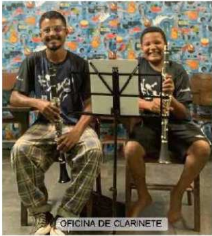
OFICINA DE CLARINETE