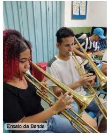
Ensaio da Banda