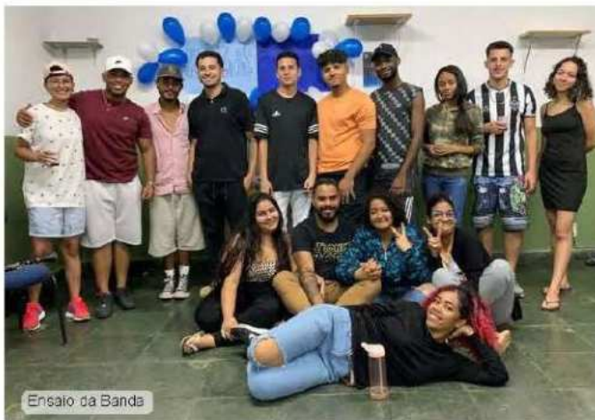
Ensaio da Banda