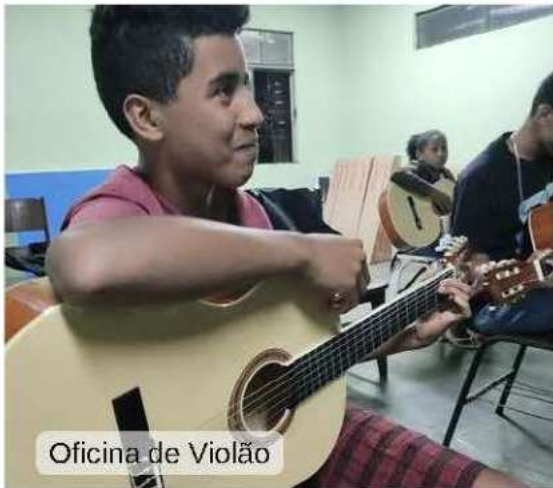
Oficina de Violão