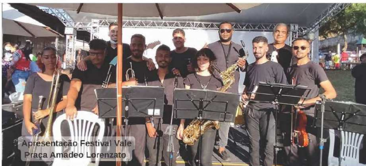
Apresentação Festival Vale Praça Amadeo Lorenzato