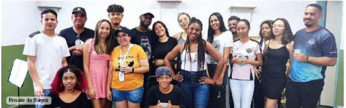
Ensaio da Banda