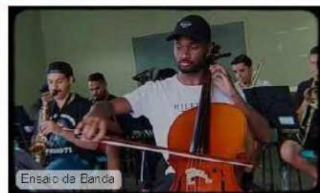
Ensaio da Banda