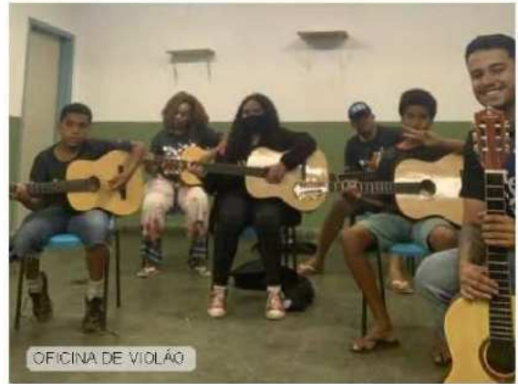
OFICINA DE VIOLÃO