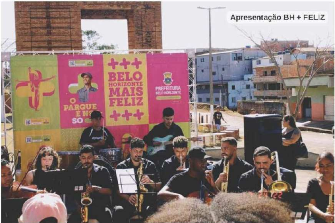
Apresentação BH + FELIZ