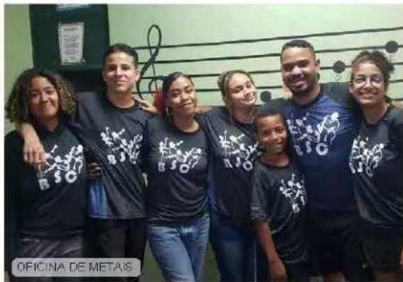
OFICINA DE METAIS