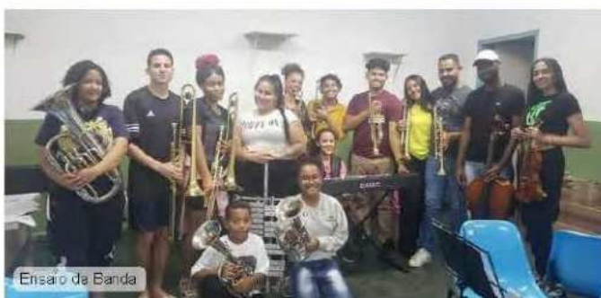
Ensaio da Banda