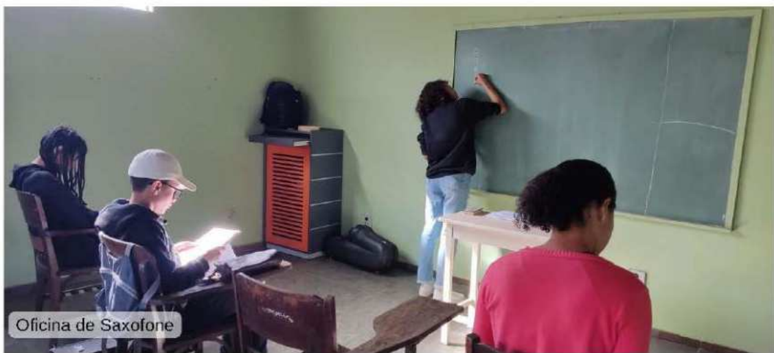
Oficina de Saxofone