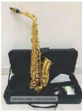
Compra dos instrumentos.